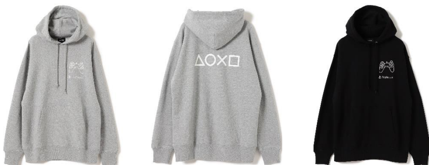
ITEM : HOODIE COLOR : GREY / BLACK SIZE : S / M / L / XL PRICE : ¥12,100 (税込み)