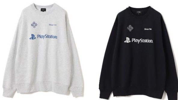
ITEM : CREWNECK SWEAT COLOR : ASH / BLACK SIZE : S / M / L / XL PRICE : ¥11,000 (税込み)

有限会社レインボーワークスでは、旬な時期に親和性のあるブランドと販路を結び付け商品企画を展開していくことでライセンスの良さを最大限に生かし、認知浸透・販路拡大に繋げてまいります。